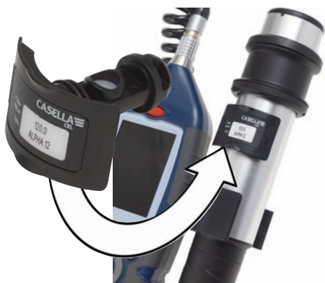
Картридж для калибровки на объекте

однако оптимальным решением является проведение ежегодной официальной калибровки прибора. Посредством опционального насоса отбора пробы воздуха Casella Tuff TM и гравиметрического адаптера пользователь может задать настройки типа аэрозольных частиц и рассчитать коэффициент коррекции для измеряемого типа пыли. Данное преимущество позволяет получить максимально точные результаты при решении конкретных измерительных задач.