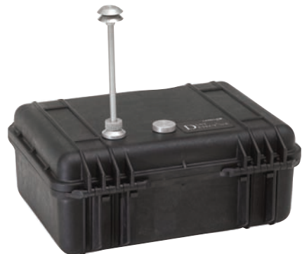
Специальный кейс Dust Detective для мониторинга в пылевых условиях