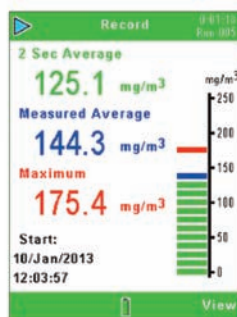
Шаг 3: нажмите кнопку "воспроизведение", чтобы приступить к измерениям