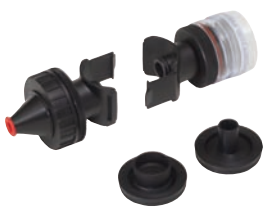
Адаптер размера аэрозольных частиц

массовой концентрации пыли в полевых условиях. CEL-712 Microdust Pro и насос отбора пробы Casella Tuff (приобретаются отдельно) помещаются внутрь кейса Dust Detective для проведения непрерывных измерений в режиме реального времени и отбора проб на гравиметрический анализ. Для получения данных о концентрации частиц размером PM10/PM2,5 или вдыхаемой пыли, Dust Detective используется в сочетании с соответствующими PUF фильтрами.