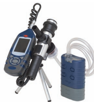
Гравиметрическая калибровка прибора для отбора пробы определенных типов частиц