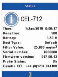
Шаг 1: включите CEL-712